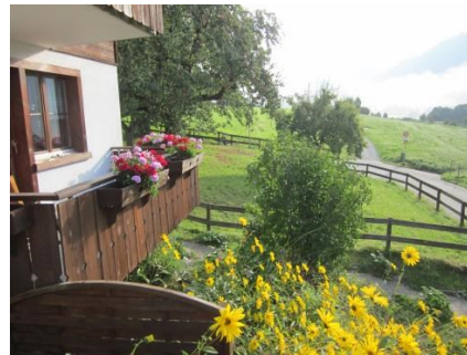
Seelsorgehaus Falerin des Vereines ICHTHYS