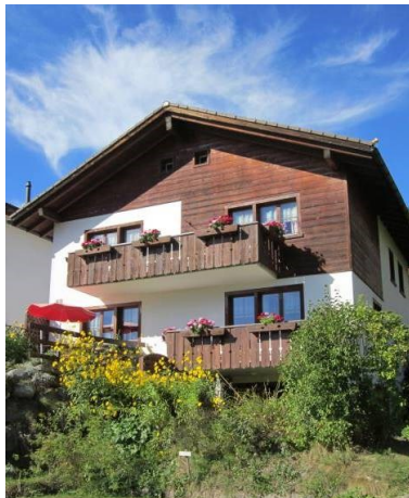
Seelsorgehaus Falerin Schluein Schweiz

Einfach sein – das Tempo verlangsamen – zur Ruhe kommen – Abstand gewinnen – neu zu sich und zu Jesus finden – Perspektiven entdecken