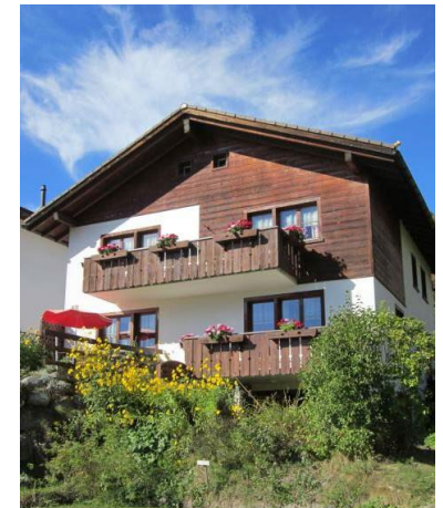
Seelsorgehaus Falerin Schluein Schweiz