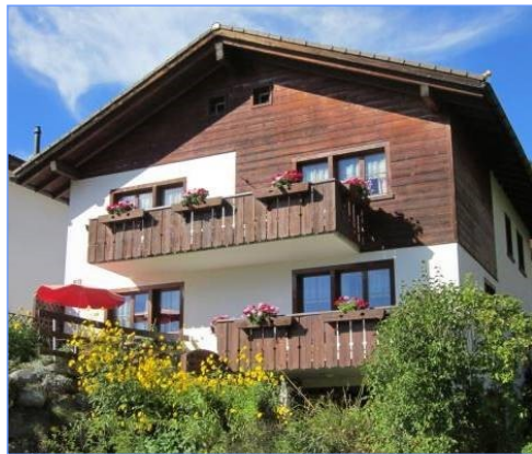
Seelsorgehaus Falerin des Vereines ICHTHYS