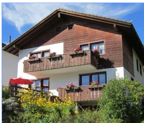
Seelsorgehaus Falerin des Vereines ICHTHYS